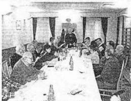
Filatelisti zeće popularizirati ovaj interesantan hobi među mladima